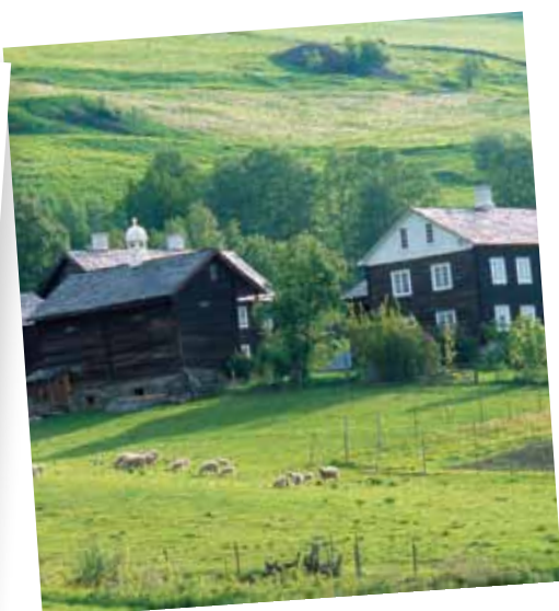
gjestegård i fjellheimen