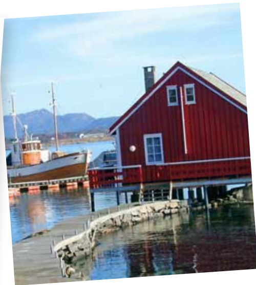
Rorbuer i nord