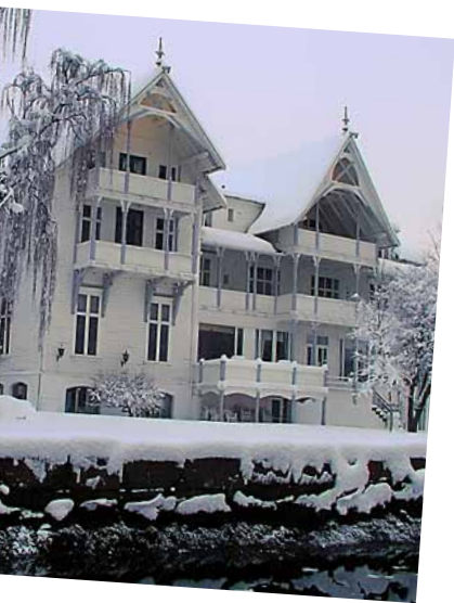
- og i vinterdrakt