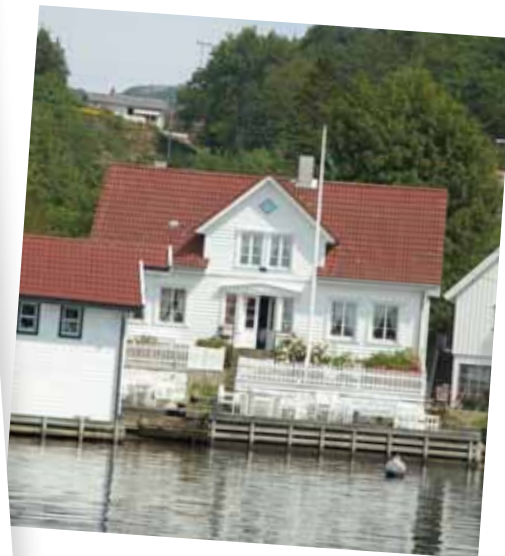
og skipperhus i sør