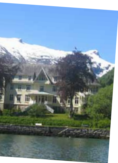
Gjestegård ved fjorden,

De håndplukkede gjestehusene yter en service man ikke opplever andre steder, og har kjøkken, natur og aktivitetstilbud som oppfyller de strengeste krav vårt marked stiller. Her finnes tradisjonsrike trehotell, mondene strandhotell, historiske skysstasjoner, fredede storgårder, værbitte fyrtårn eller særpregede høyfjellshotell – noe for enhver smak!