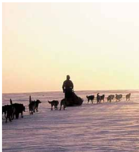
Med hundeslede over vidda