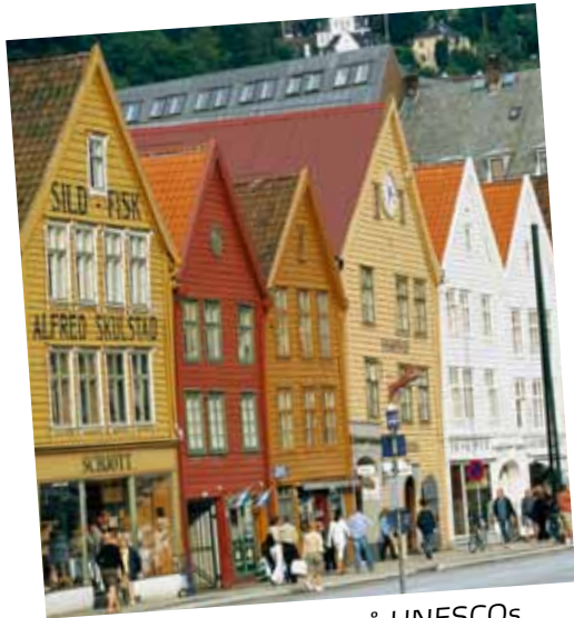
Bryggen i Bergen, på UNESCOs verdensarvliste