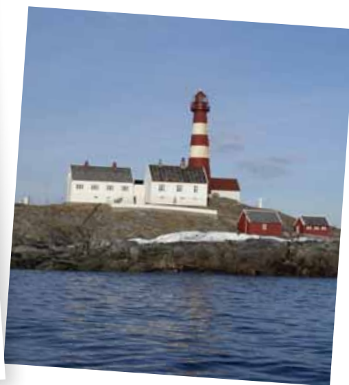
- og fyrtårn ute i havgapet