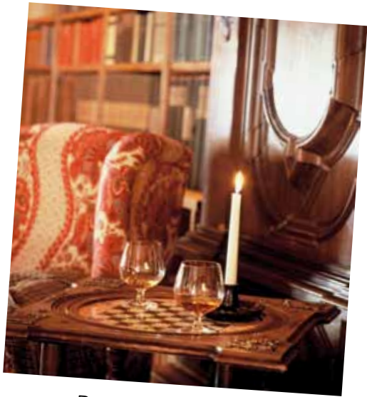
Den lune rammen og...