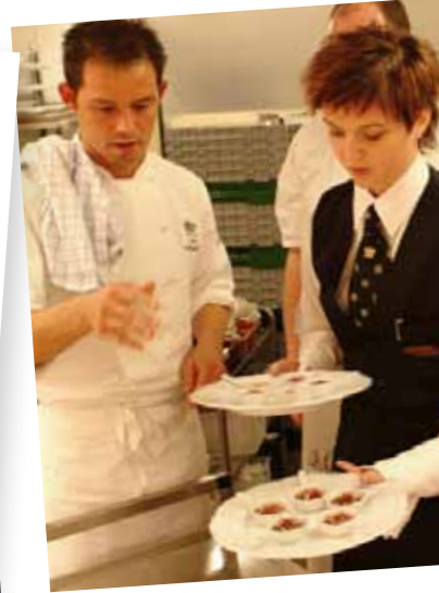
- krones med kulinariske n