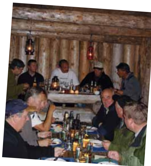
her flyter samtalene lett