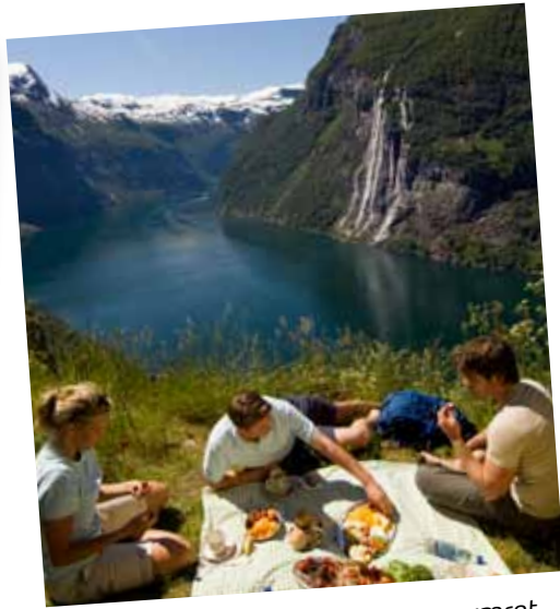
...de unike omgivelser for samværet