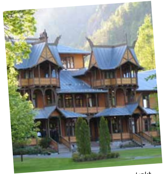
Historiske trehotell i sommerdrakt