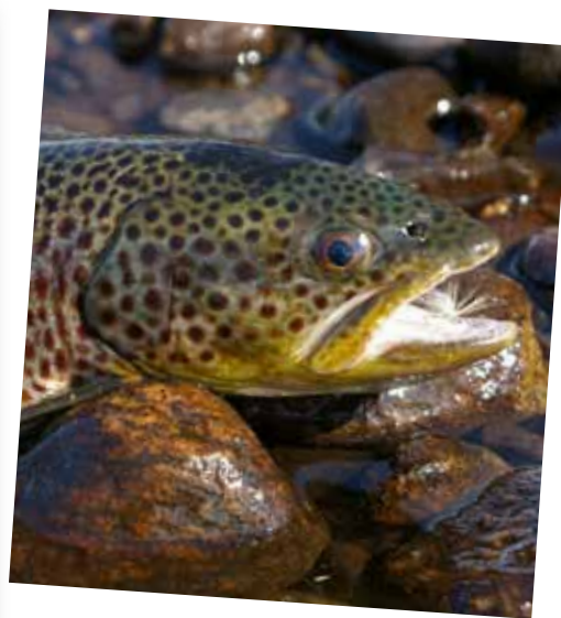
- egen fangst?