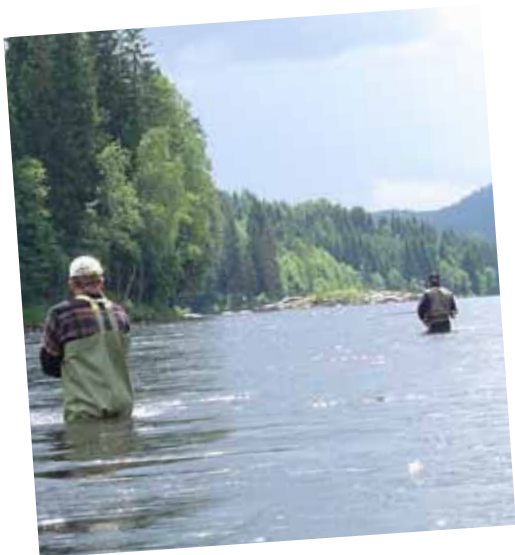
Her finner man roen,